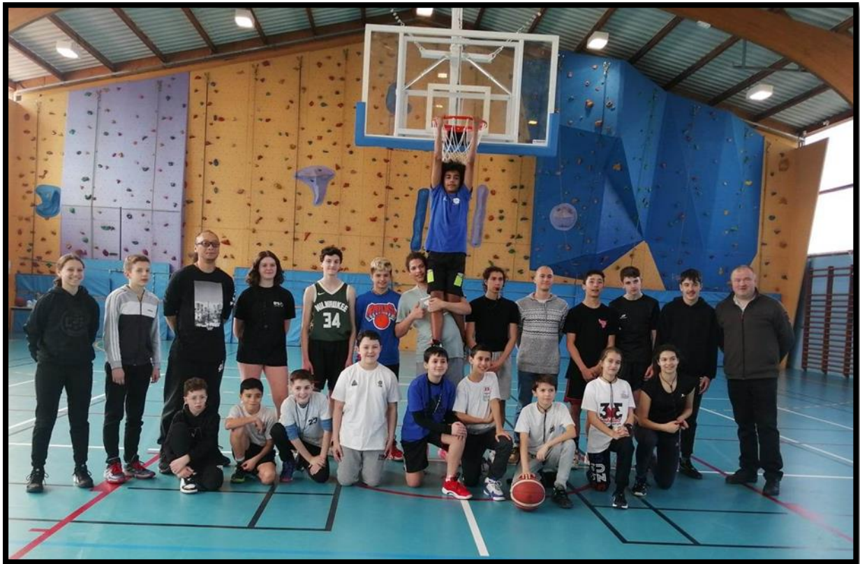
L'ensemble des candidats à la formation pour la saison 2022 - 2023

La formation se poursuit pour nos 13 candidats à l'Examen Arbitre Départemental du CD de la Creuse ainsi que nos 5 arbitres clubs qui ont souhaité poursuivre avec le groupe en vue de se préparer pour la saison prochaine.