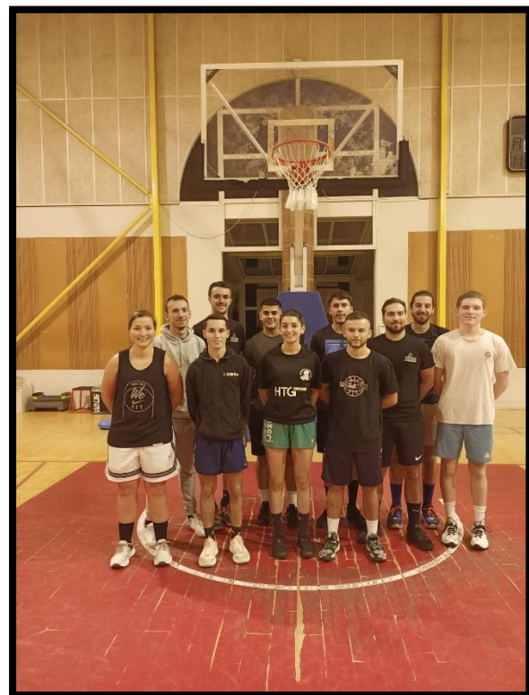
La composition des Groupes PERF NORD et SUD